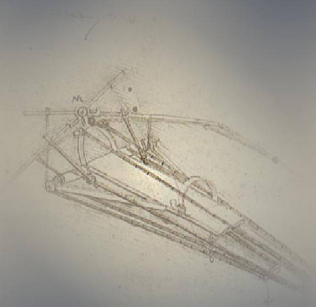
Máquina voladora. Leonardo da Vinci.